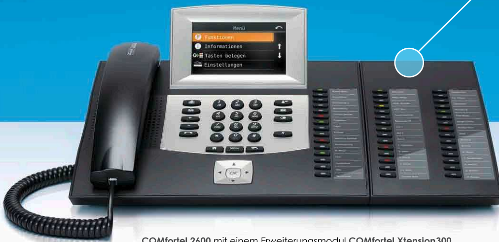
COMfortel 2600 mit einem Erweiterungsmodul COMfortel Xtension300.

Jede COMfortel Xtension300 stellt 30 zusätzliche Tasten zur Verfügung. Bis zu drei dieser Erweiterungsmodulare lassen sich blitzschnell anschließen und programmieren.